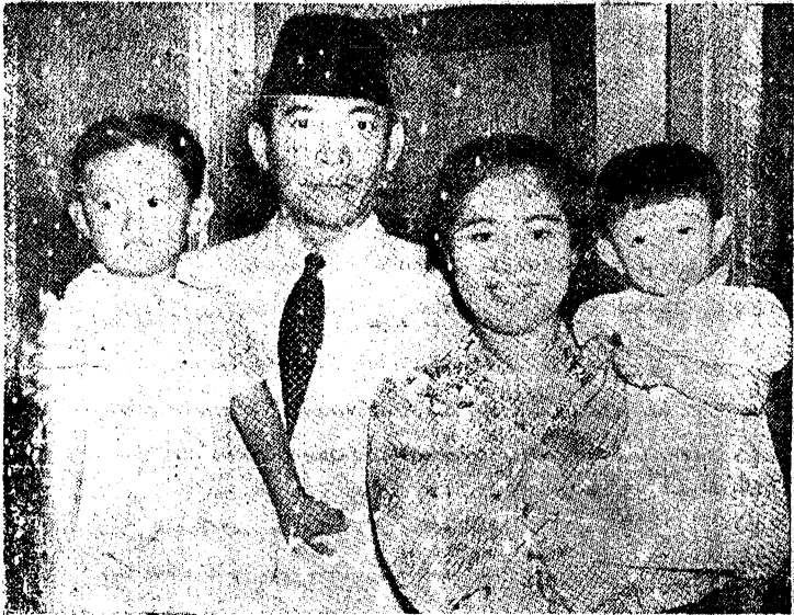
P. J. M.M. Presiden SOEKARNO Dalam suasana keluarga, Njonja, Guntur, Megawati